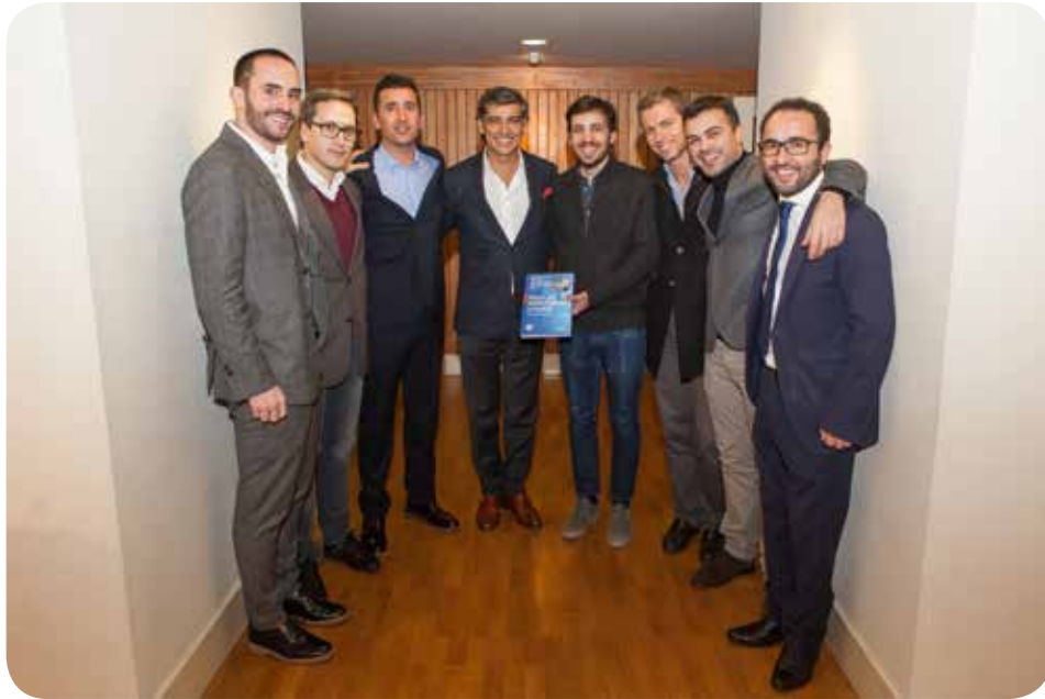
A Equipa da Dom Henrique Research Centre e da Clínica do Dragão Espregueira-Mendes Sports Centre, FIFA Medical Centre of Excellence