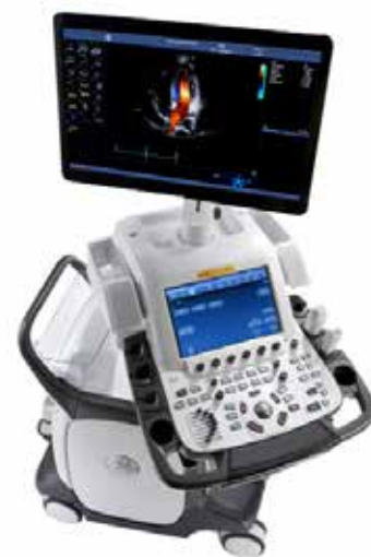
VIVID E95 – A melhor imagem 3D/4D, para todas as idades, rápida e sem radiação.