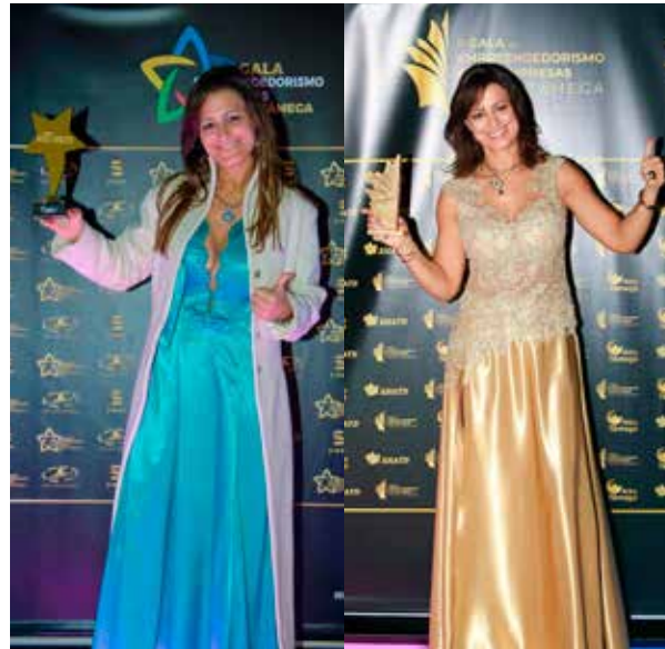
I e II Gala Empreendedorismo e Empresas do Alto Tâmega

Pessoalmente, após a conclusão da licenciatura, a nossa entrevistada apostou em formações que lhe concederam uma perspetiva global das várias subespecialidades da Medicina Dentária, sendo que, quando optou por oferecer um serviço assente na diferenciação e especialização, delegou as restantes áreas para colegas da